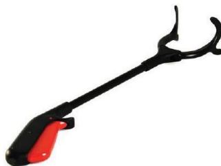
Рисунок 3. Устройство для удаленного захвата

Если вам нужно поднять упавшие предметы с пола, используйте захват, который продается в специализированных магазинах вспомогательных средств (см. Рисунок 3). Если нет захвата, при сгибании нужно опереться на мебель одной рукой и отвести назад противоположную ногу, а затем поднять предмет.