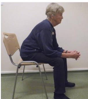
Рисунок 6. Поза, способствующая расслаблению