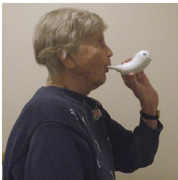
Рисунок 6. Вспомогательное средство Шейкер

Сядьте, возьмите бутылку в руки или поставьте ее на стол перед собой. Спокойно вдохните через нос, поместите трубку в рот и выдыхайте максимально воздух из легких в течение 3-4 секунд, чтобы вода в бутылке стала пузыриться (см. Рисунок 8). Повторяйте упражнение 10 раз не менее 3-5 раз в день или по плану в соответствии рекомендациями физиотерапевта. Ежедневно промывайте бутылку и трубку! NB! Занимайтесь данным упражнением вместе с контролем дыхания, избегайте слишком резкого и глубокого дыхания. В то же время дыхание не должно быть слишком коротким или слишком слабым.