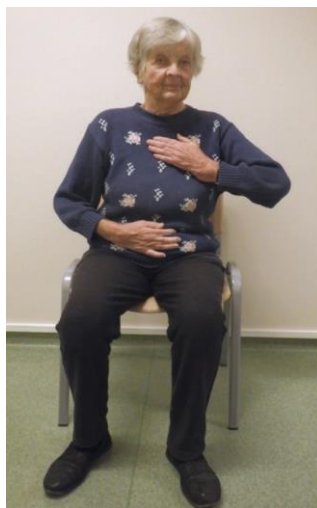
Рисунок 4. Диафрагмальное дыхание, т.е. дыхание с помощью промежуточных мышц