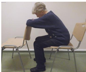
Рисунок 7. Поза, способствующая расслаблению