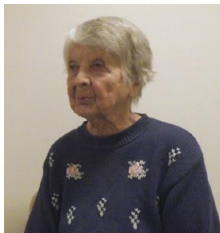
Рисунок 5. Дыхание через сложенные трубочкой губы