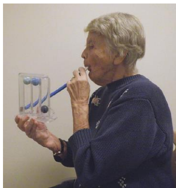
Рисунок 10. Тренировка дыхательных мышц (Triflo)

3. Для максимального потока верните мундштук в рот и сделайте вдох так, чтобы все шарики поднялись. Затем спокойно выдохните через сложенные в трубочку губы. NB! Держите устройство вертикально. Следите за своим дыханием и старайтесь не задышаться во время работы с устройством, так как это утомительно и неэффективно.