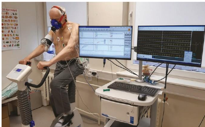
Рисунок 1. Кардиопульмональные нагрузочные тесты на велоэргометре

шестиминутная ходьба (БМКТ), челночная ходьба и тесты на вставание. Ваш врач может проведение тестов до и после восстановительного лечения. Эти тесты используются для наблюдения за динамикой состояния вашего здоровья и оценки эффективности лечения.