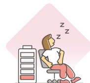
Nõrkus või väsimus