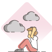
Rahutus või närvilisus